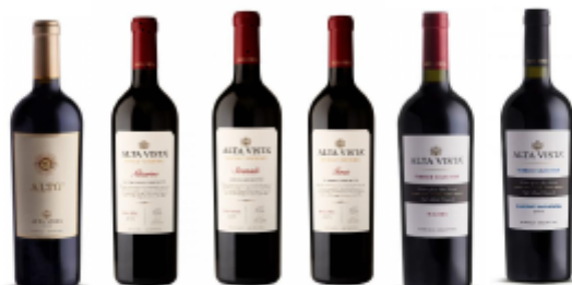
Botellas de vino nombradas, en orden ((izquierda a derecha) respectivamente.

TERROIR SELECTION CABERNET SAUVIGNON: Producido bajo el mismo concepto de Terroir Selection Malbec, este Cabernet Sauvignon es el resultado de la combinación de uvas de dos de nuestros Terroirs: Albaneve y Temis. La proporción varía según la cosecha, pero su estilo está determinado por el carácter de cada terruño y por el proceso de envejecimiento de 12 meses en barricas nuevas de roble francés.