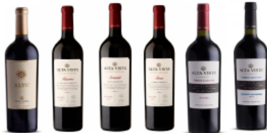
Botellas de vino nombradas, en orden ((izquierda a derecha) respectivamente.

TERROIR SELECTION CABERNET SAUVIGNON: Producido bajo el mismo concepto de Terroir Selection Malbec, este Cabernet Sauvignon es el resultado de la combinación de uvas de dos de nuestros Terroirs: Albaneve y Temis. La proporción varía según la cosecha, pero su estilo está determinado por el carácter de cada terruño y por el proceso de envejecimiento de 12 meses en barricas nuevas de roble francés.