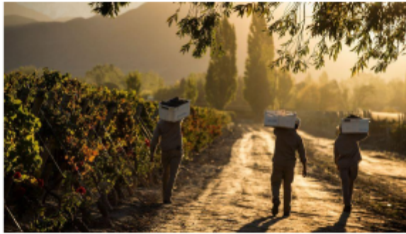
Vinédos de Alta Vista.

Le dan gran importancia al cuidado de sus uvas, en palabras de un empleado "la importancia y cuidado que le damos a nuestras uvas, es lo que marca la calidad de nuestro vino"