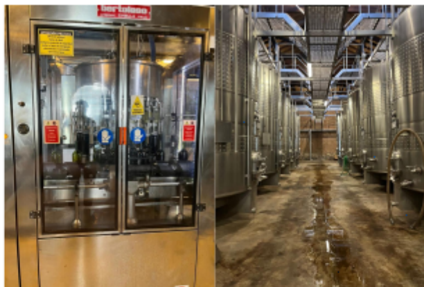
(3) Máquina de llenado de botellas. (4) Tanques de almacenamiento de acero inoxidable