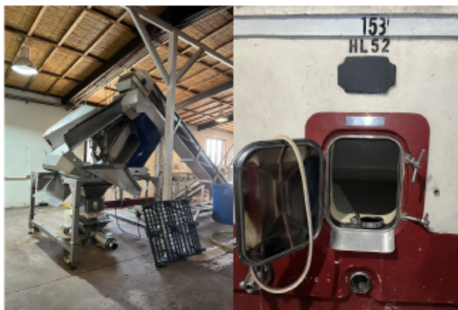
(1) Máquina Despalilladora Bucher. (2) Tanques de hormigón recubiertos de epoxi

Gracias a su amplia instalación tecnológica la bodega puede realizar casi todos sus procesos, solo terciarizan la filtración tangencial y el tapado de botellas "tapa rosca".