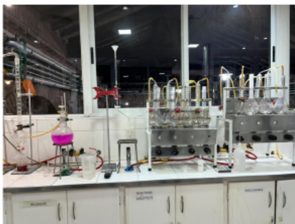
Laboratorio de Análisis