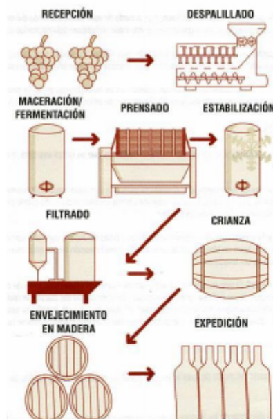
Proceso Productivo del Vino

La principal diferencia entre el proceso del vino blanco y el vino tinto es su proceso de maceración. El vino tinto se macera con sus hollejos y semillas, mientras que el vino blanco se prescinde de la piel de la uva y se fermenta solo con el zumo obtenido de la pulpa