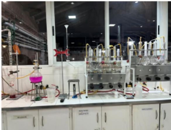
Laboratorio de Análisis