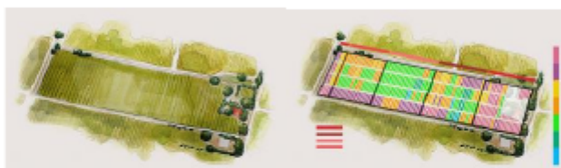
Mapas conceptuales del viñedo con estudio interparcelario.

Desde 2007, con un fuerte conocimiento de las zonas vitícolas, hemos realizado un estudio en cada viñedo para conocer el comportamiento de las parcelas. El objetivo es obtener zonas de cosecha homogéneas en cada fracción del terreno para ingresar uva de iguales características en las piletas. La obtención de una cosecha uniforme incrementa el potencial de calidad del vino.