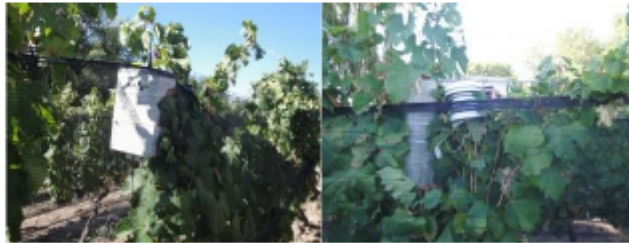
Captore de temperatura ubicados en los viñedos.

Desde 2011 desarrollamos trabajos de investigación en los viñedos, con un equipo multidisciplinario liderado por el CNRS (Centro Nacional de Investigación Científica de Francia). El objetivo es determinar las variaciones climáticas a la escala fina del terroir, para poder adaptar las prácticas vitivinícolas al contexto del cambio climático.